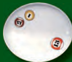
piatto unico ovale cm.29 x 25