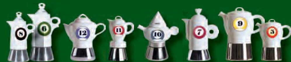
Espressine classic e a-portèr